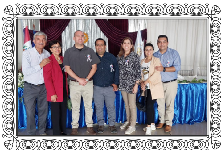
Foto oficial Ceremonia de Celebración Patrio en Tacna - Perú

En la actividad participaron diversos clubes de las ciudades de Tacna, Arequipa y Arica, lo que posibilitó la fraternidad y la amistad, junto a amigos rotarios residentes en Chile y Perú, instancia que a la fecha se ha transformado en un hito que se repite continuamente durante el transcurso de los años, potenciando y robusteciendo los lazos de amistad entre estos clubes de ambos países.