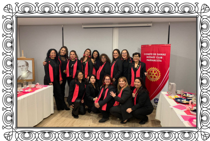
Foto oficial Comité de Damas Rotary Club Parinacota