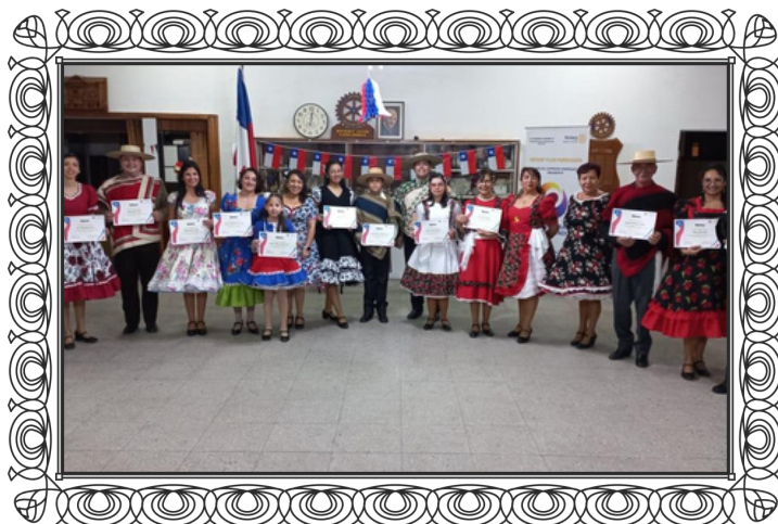
Foto Oficial de Finalización del Taller de Cueca Rotaria 2023

Cabe destacar que no es el primer Curso de Cueca que organiza Rotary Club Parinacota reafirmando el compromiso con las tradiciones patrias en la puerta norte de nuestro país, lo que permite que podamos desarrollar nuestro baile nacional, no solo en fiestas patrias, si no que en cada ocasión en que debamos hacerlo.