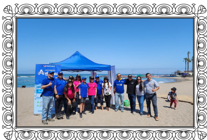
Foto oficial Operativo de Limpieza Playa La Lisera

Esta actividad se desarrollo en conjunto con diversos actores de la cuidad, ente los que podemos mencionar a agrupaciones de Guías y Scouts de Arica, Buceo Profesional Hippocampus, Programa Olas Zero Plástico, Clubes Rotarios de Arica, entre otros.