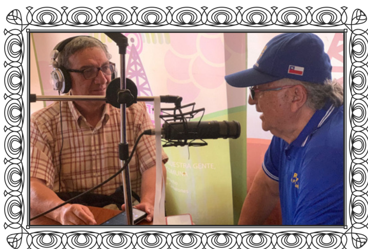
Foto de la Entrevista en Radio Pintatani del Valle de Codpa