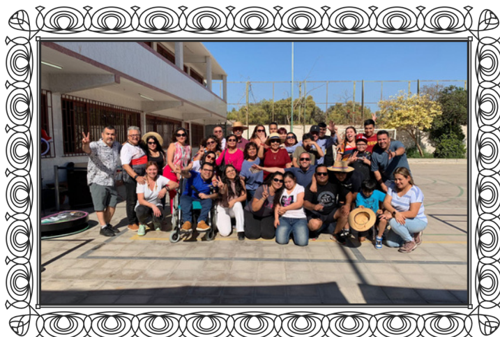
Foto oficial Ramadas Rotary Club Parinacota

En la jornada del 14 de Septiembre, 3 integrantes de las damas, fueron las invitadas especiales a presenciar la tradicional Gala Folclórica, en donde en esta ocasión se llevó a cabo en el establecimiento de la Escuela Especial CRISOLVI de la ciudad de la eterna primavera.