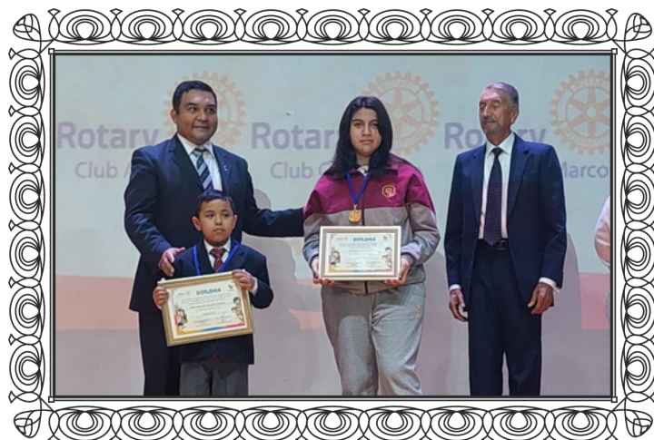
Entrega de Reconocimientos por Semana del Niño - Colegio Saucache

Este año, y en coordinación con los Presidentes de las Juntas Vecinales de las localidades de Codpa, Amanzaca, Guañacagua y Cerro Blanco, se realizó la entrega de una donación consistente en diversos enseres para el hogar, ropa de abrigo y útiles de aseo sanitarios a la comunidad de los distintos poblados del Valle de Codpa.