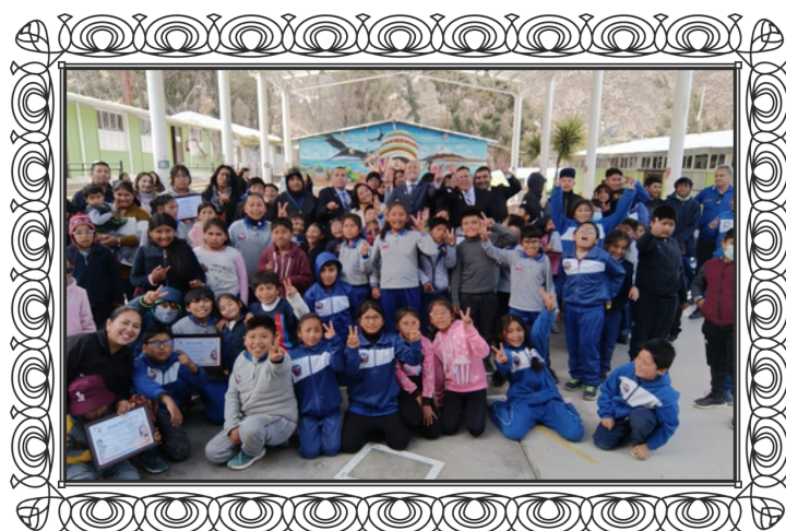
Foto oficial Reconocimiento Día del Niño en localidad de Putre

Esta actividad, marca un hito, ya que se realizó a más de 3.500 msnm., y a 135 Km., de la ciudad de Arica, a través de un inhóspito recorrido, en la Escuela ubicada más al norte de nuestro país.