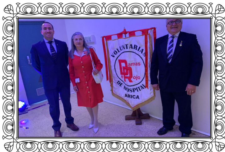
Foto oficial Celebración a las Damas de Rojo del Hosp. Juan Noé Crevanni

También, dentro del Proyecto Banco de Sillas de Ruedas, se hizo entrega de una Silla de Ruedas, la que permitirá facilitar, el traslado de pacientes dentro del recinto hospitalario por parte de las Damas de Rojo.